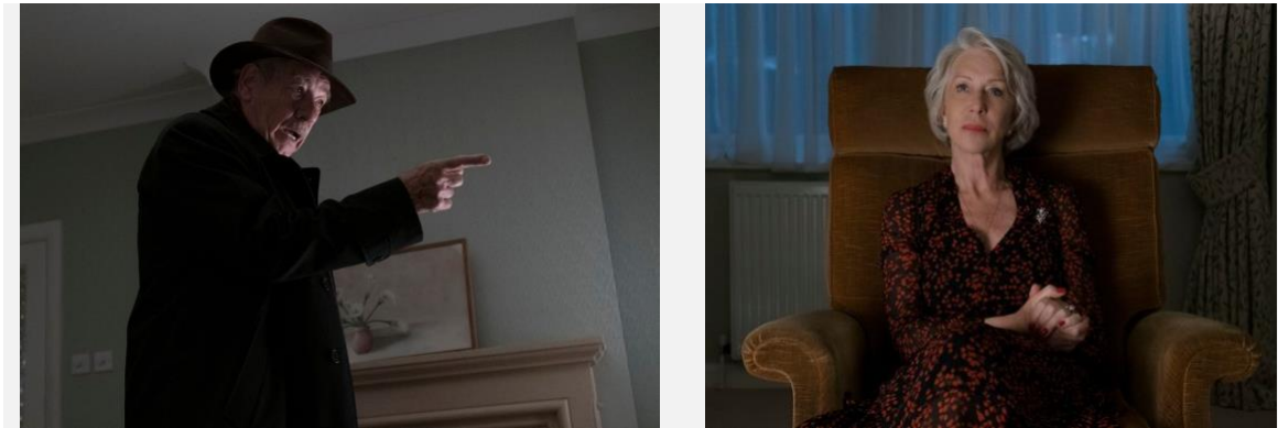
Figura 04 – Cena do filme onde Betty confronta Roy sobre questões do passado

Os personagens rompem com diversos estereótipos, tais como: a) Inteligência estratégica: ambos mostram capacidade analítica e calculista; não são ingênuos nem cognitivamente limitados; b) Autonomia financeira e social: gerenciam seus próprios bens, rotinas e relacionamentos; c) Complexidade emocional: não são simples, frágeis ou previsíveis; e, d) Capacidade de ação: a velhice não os impede de planejar, investigar, manipular, resistir ou enfrentar conflitos. Particularmente, a personagem de Helen Mirren, Betty McLeish, desconstrói a imagem da “idosa frágil”: ela é forte, emocionalmente resiliente e determinada.