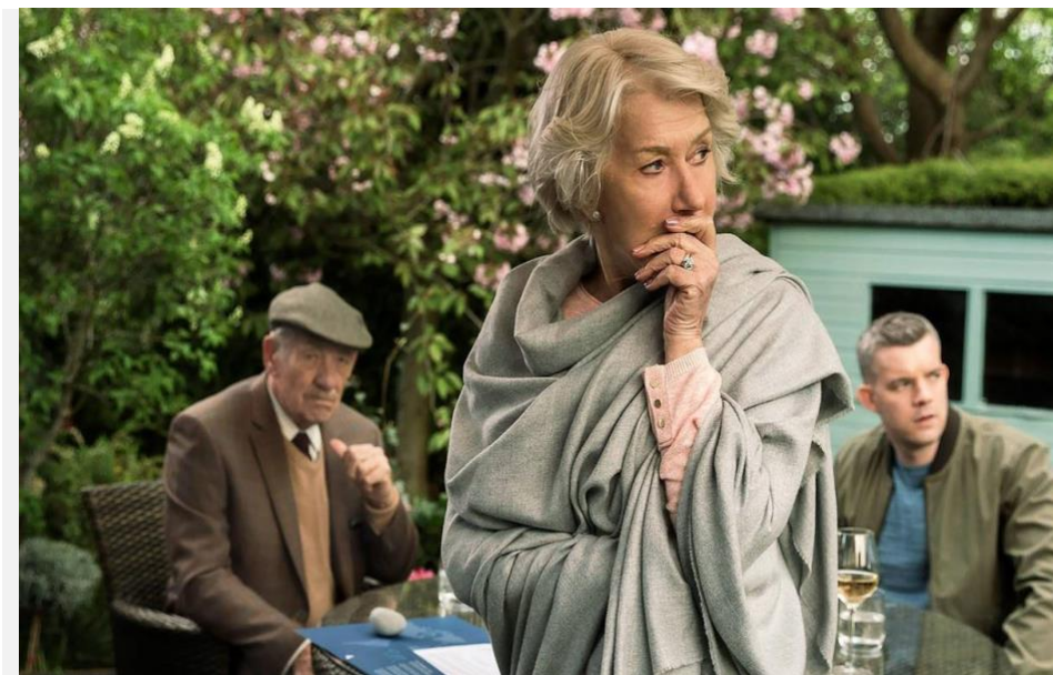
Figura 05 – Cena do filme onde ambos suspeitam um do outro 2

O protagonismo de Betty e Roy dialoga com o conceito de envelhecimento ativo. O filme posiciona idosos como agentes que pensam, decidem, planejam e confrontam situações complexas, refutando a associação automática entre velhice e impotência. Nesse sentido, o filme reforça o conceito de New Older Living Trend (NOLT). Conforme Carvalho (2026), esse termo surgiu nos Estados Unidos e se difundiu nas redes sociais fazendo a defesa de uma velhice atrelada a atividade, ao vigor físico e cognitivo e ao padrão estético de juventude.