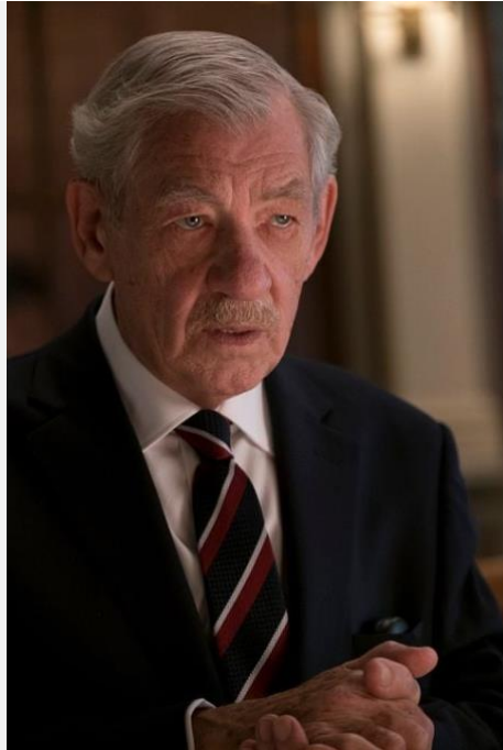
Figura 01 – Personagem Roy Courtney